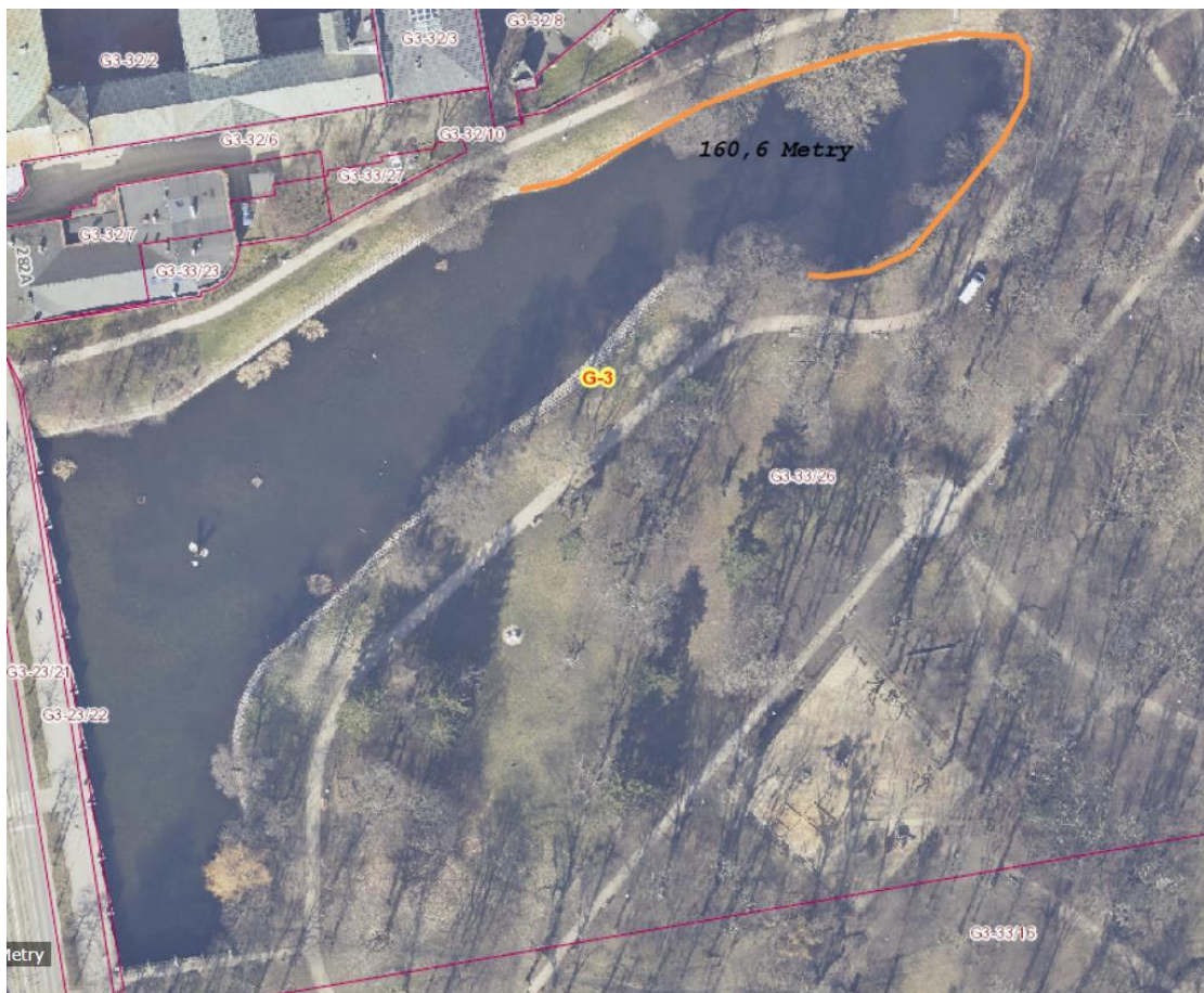
Rys. 2. Proponowany odcinek linii brzegowej stawu w parku miejskim im. W. S. Reymonta w Łodzi., do prowadzenia prac nasadzeniowych.