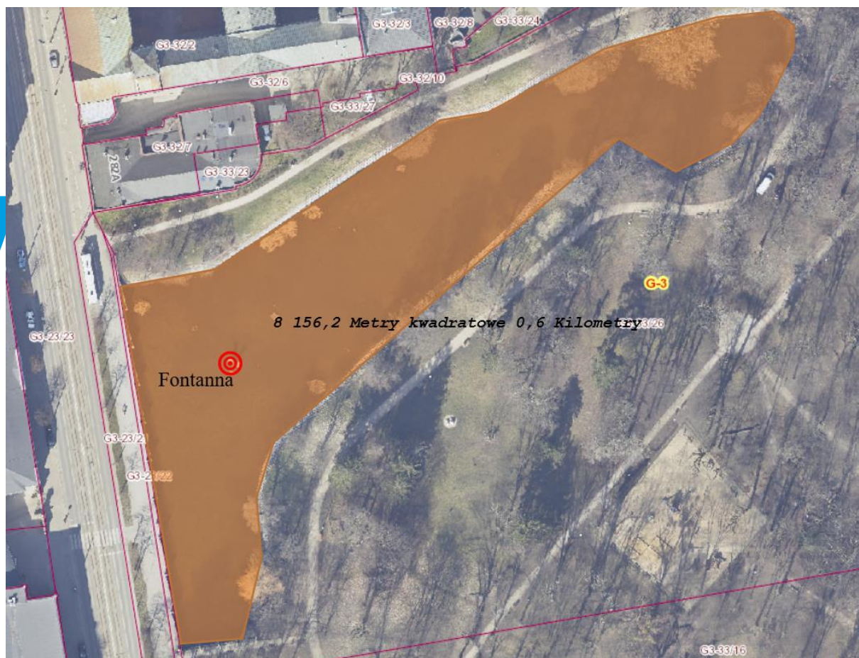
Rys. 3. Lokalizacja stawu w parku miejskim im. W. S. Reymonta w Łodzi.